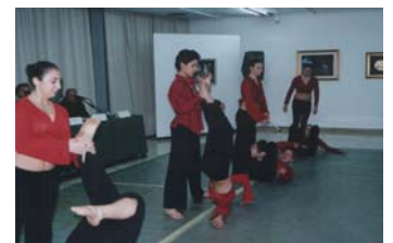
Centro di danza "Silfide"