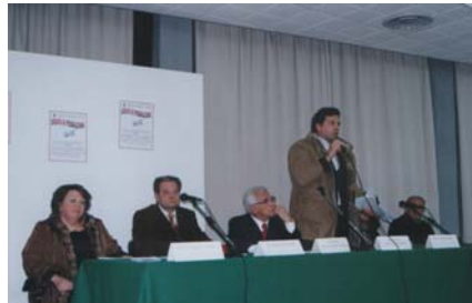
I componenti della Giuria